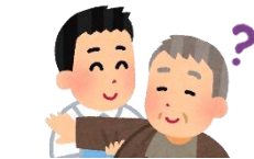
詳細な認知機能のモニタリング