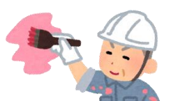
ボランティア活動を目的に利用