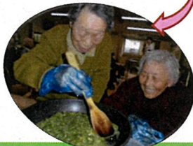
ふき味噌作りしました！