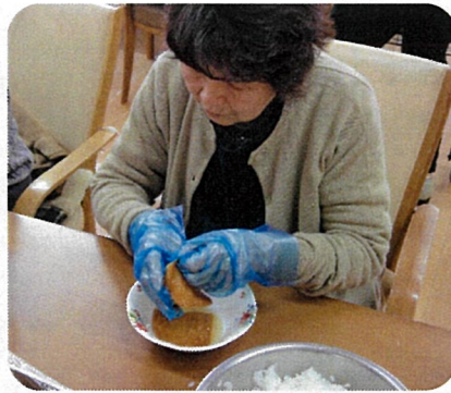
お昼のいなり寿司作りも手慣れた手つきであっという間に完成！