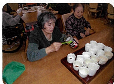
3時のコーヒータイム、全員分の飲み物を作っています！

すぐに洗濯物たたみに取り組まれています。この日は、女性陣がたたんでいる所へ男性陣もお手伝いに…更には、たたんだものを浴室まで運んでくださる助っ人が！まさにチームプレイ！思わず、追っかけて、写真に収めました(笑)自ら取り組まれるその意欲を大切にしたいものです。長い間、ご自宅等でしてきたことがいつまでも続けられる環境をつくり、皆様の機能維持の一助になればと思います。