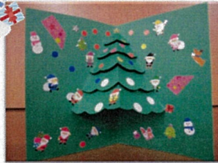
手作りのリースやクリスマスカードを作成し、プレゼントいたしました！