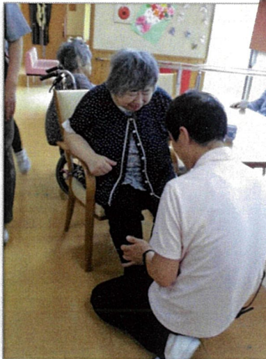
臀部の上げ下げを行っています。