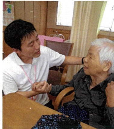
訓練がおわると、サインをいただいています。