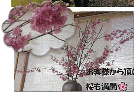
お客様から頂いた 桜も満開