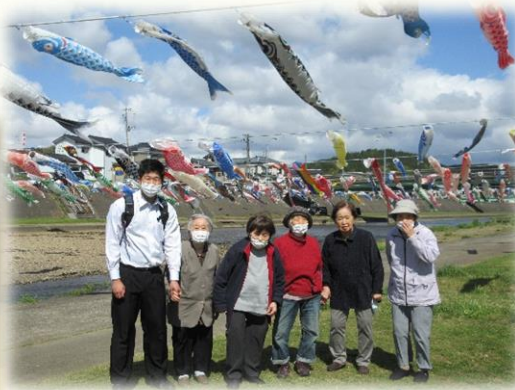
お馴染み加茂川の鯉のぼり