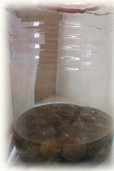
大分シロップが出てきました。