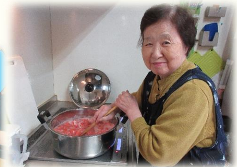
頂いたイチゴでジャムを作りました。