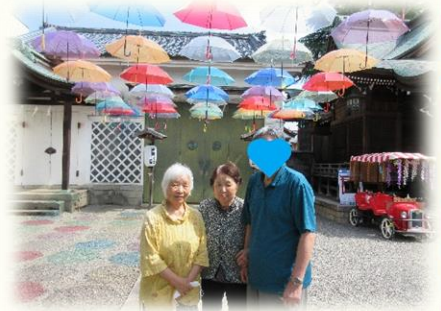
八幡様で傘が吊るされてました。

お客様のワクチン接種も次第に終わってきており、コロナウイルスに負けない日々を過ごしましょう。オリンピックも楽しみですね。