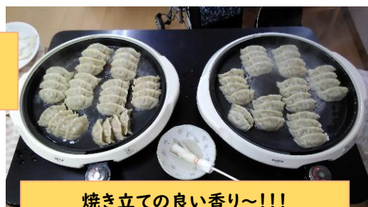
焼き立ての良い香り~!!!