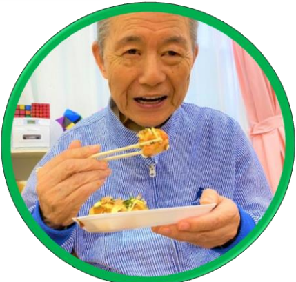
たこ焼きにかき氷、チョコバナナ 沢山食べましたー!!