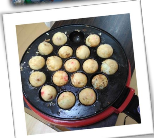
たこ焼き美味しそー♪