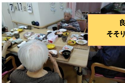
良い香りで食欲 そそりました(*´艸`)