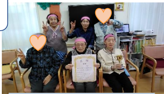
最後は皆さんで記念撮影📷