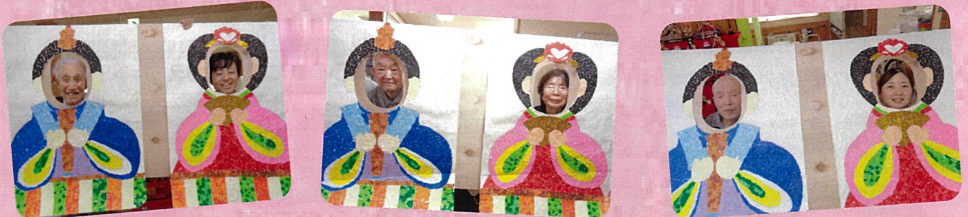
お雛様とお内裏様の顔だしパネルを作ってみました♪